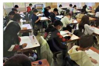
12/15 標準学力調査で力試し (4.5.6年生)

23日から約2週間の冬休み期間に入ります。年末年始は地域や各家庭で、大掃除や正月飾り付け、初詣など、様々な年越しや正月行事が予定されています。是非、お子さんに役割を与えて取り組ませ、日本の文化を学ばせるとともに、家族の一員として生活する充足感を味わわせてほしいと考えます。