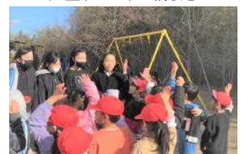
寒空の下 元気に鬼ごっこ

御協力ありがとうございました。お陰様で書き損じはがきが85枚も集まりました。宮城県視覚障害者福祉協会に寄付させていただきました。