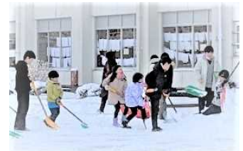
自主的に雪かきを手伝う たくさんの児童

自分から進んで行く「求める心」、利府三小のためを思って働く「美しい心」、自分の役割“以上”のことを果たそうとする「強い心」、そして雪かきする職員に“ありがとう”と言える「感謝の心」。利府三小の四つの心が育っていることを感じました。