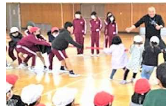
大盛り上がりの綱引き

昼休み時間を使って、体育委員の5・6年生が、下級生たちを集めて一緒に遊んでいます。「鬼ごっこ」「綱引き」「長縄跳び」など、週ごとに様々な遊びに取り組んでいます。寒い冬も、楽しみながら積極的に体を動かし、体力向上を図っています。