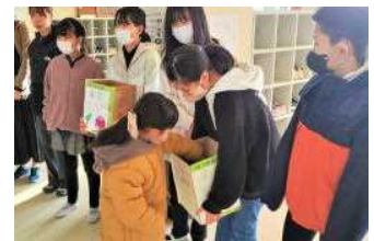
児童の発案で始めた募金活動

計画委員の5、6年生が朝の昇降口に立ち、「地震で大変な思いをしている人たちのために、募金活動に御協力ください」と呼び掛けました。保護者の皆様の御理解・御協力もあり、多くの児童から募金が集まりました。集計を行い、被災地に届ける予定です。