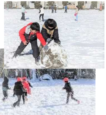
白銀の校庭で大はしゃぎ

残りの授業日数は少ないですが、進級・進学した時の自分を意識させながら諸活動に取り組ませ、子供たちを成長させていきたいと考えます。